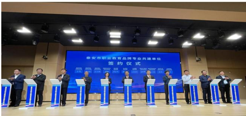
图 08：泰安市成立职业教育发展共同体

泰安市创新职业教育发展模式，成立全市职业教育发展共同体。加快构建以高职院校为主导、中职学校为主体、企业深度参与的“学科共建、资源共享、人才共育、绩效共评”的职业教育办学模式新机制，紧密对接山东省 10 大重点产业和泰安市新型工业化强市建设 11 条重点产业链，集中力量重点共建 13 个具有区域特色和行业影响力的品牌专业（群）。共同体成立的经验被市委杨书记签批表扬，市委改革办作为改革典型案例全市推广。