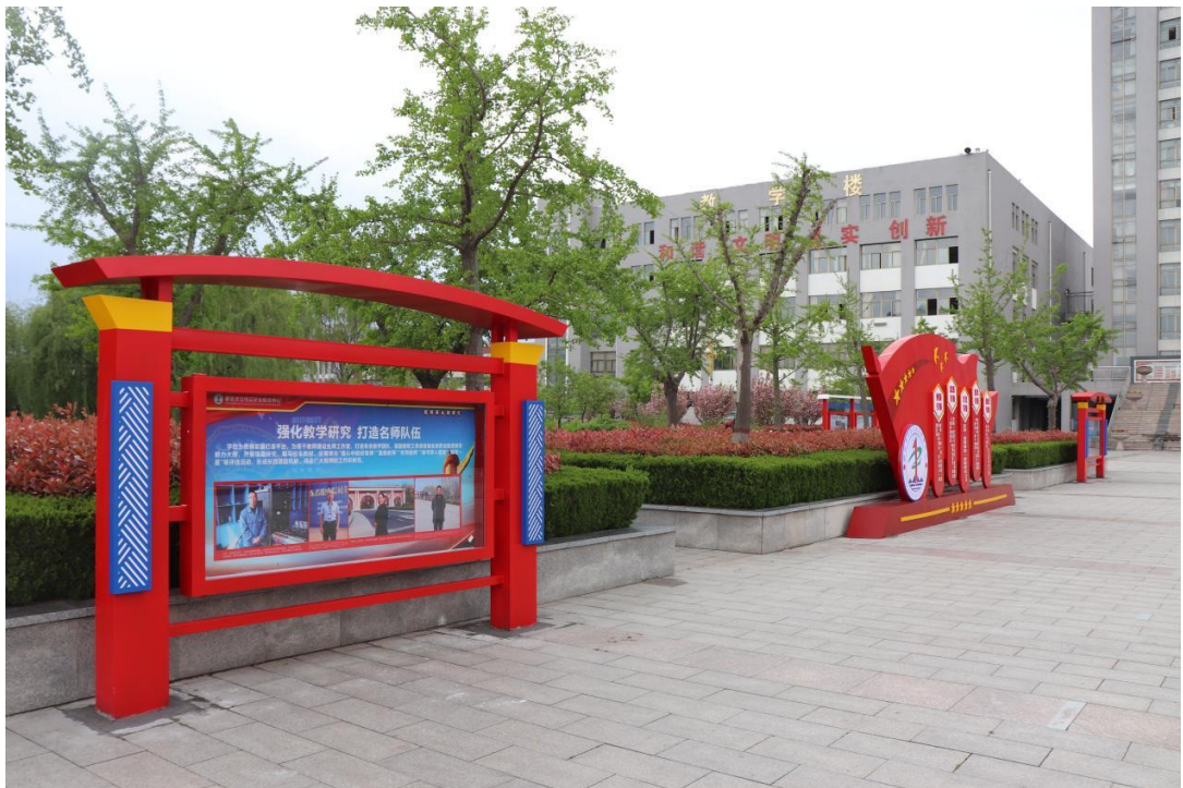
图 07：泰安市岱岳区职业中等专业学校求实广场党建特色文化

的校园文化育人氛围。围绕“实”的核心理念，充分发挥学生积极性，征集广大师生意见，完善了学校楼宇、道路、园区和人工湖等特色命名。在校园新建中心求实文化广场，结合各专业部专业特色和育人内涵，建设各专业部特色文化长廊和班级文化阵地，营造了积极向上的校园文化氛围，既为同学们的聪明才智提供了舞台，又扮靓了教室、美化了校园。