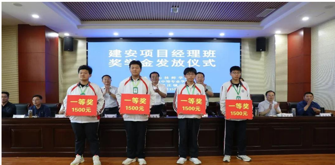
图 03：2024 年肥城市建安项目经理班奖学金发放仪式

所需的高技能人才 100 余人，助力企业高质量发展。2024 年学校与安驾庄镇人民政府合作设置“建安项目经理班”，安驾庄镇人民政府每年拿出一定的经费奖励学业成绩和综合素质考核优秀的同学，极大地提高了学生的学习积极性。