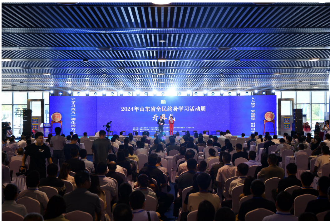
图 05：山东省 2024 年全民终身学习活动周启动仪式在泰安市举办