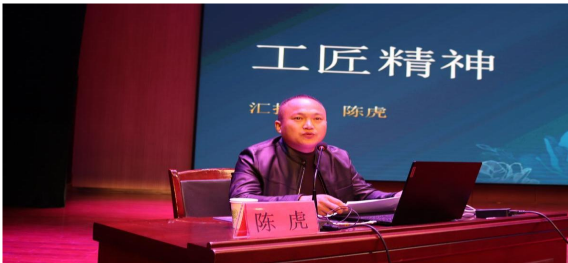
图 06：劳模工匠大讲堂

泰安市理工中等专业学校课程思政一直聚焦劳动精神、劳模精神和工匠精神教育，通过开设“职业生涯规划”课、打造“工匠精神”思政课教学专题、邀请劳模进校园现身说法、带领学生走进校外实训基地开展实践教学、组织学生在校内校外开展劳动实践系列活动，“五措并举”推动劳模精神、劳动精神和工匠精神教育，融入思政课教学。